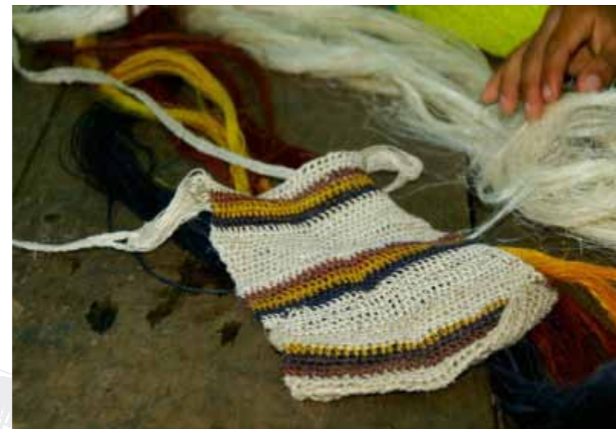
Artesania's: een traditionele tas van plantenvezels

De Grupo Roga-Ngöbere, een indianengemeenschap in Alto Laguna Osa in het zuidwesten van Costa Rica, is al sinds 2001 bezig met ecotoerisme op