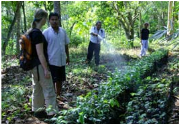
Een boomkwekerijtje van de Terraba-indianen