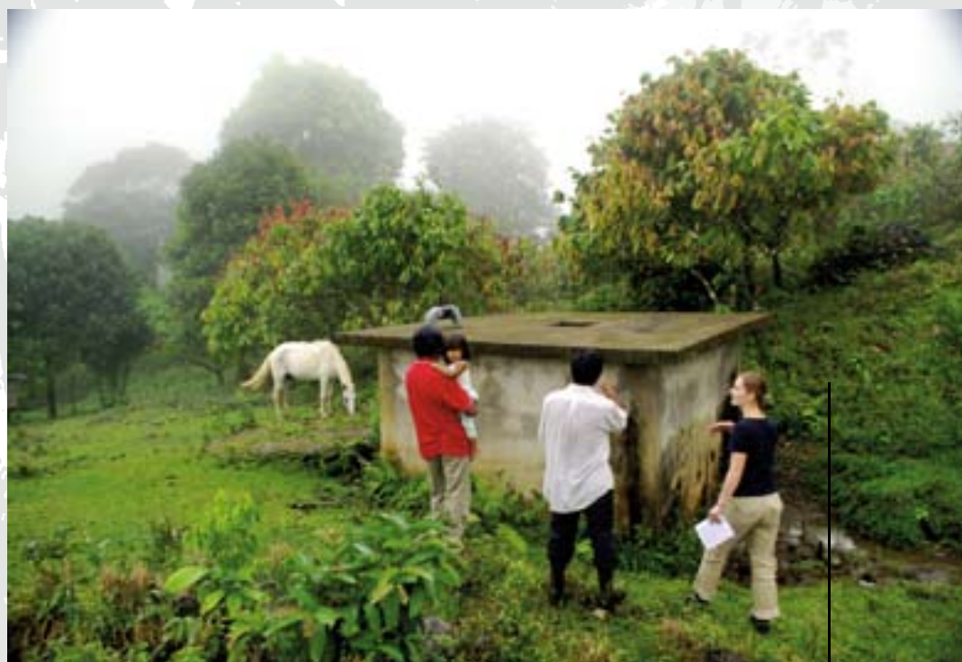
Een medewerker van het ITF bezoekt een waterbassin dat is aangelegd op Ngöbegue-land.

Particulieren krijgen verslag van de resultaten in deze nieuwsbrief; grotere donoren ontvangen aparte projectverslagen. De uitgebreide reisverslagen van ITF-leden kunt u vinden op onze website www.itf.nl .